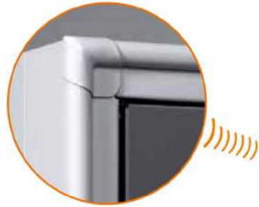
Bordo arrotondato antiurto Rounded edge Bord arrondi antichoc Abgerundete Vorderkante