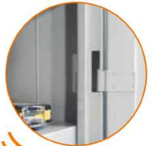
Cerniere interne anti effrazione Internal hinges Charnières spéciales anti-effraction Einbruchssichere innenliegende Scharnieren