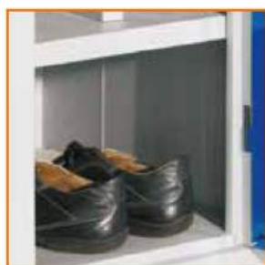
Piano porta scarpe vano unico Shelf for shoes "I" shape Étagère pour Chaussures Breites Schuhfach