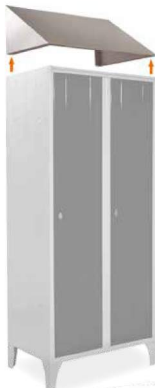
Tetto inclinato Sloping tops Coiffes inclinées Schrägdach