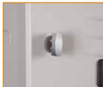
Maniglia in metallo lucchettabile a frizione con sistema anti effrazione Freewheeling padlock handle Fermeture à cadenas Sicherheitsdrehriegel für Vorhängeschloss