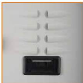
Porta cartellino in materiale plastico Plastic card holder on door Porte-étiquette en plastique Namenschildhalter aus Kunststoff