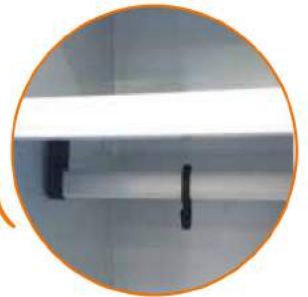
Tubo ovale appendiabiti in PVC Plastic coat hanger rod with sliding hooks Tringle porte-cintres en PVC Oval Rohr aus PVC mit Kleiderhaken