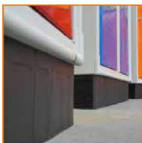
Zoccolo di base in plastica Plastic plinth Socle en polypropylène Sockel aus Polypropylen