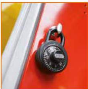
Lucchetto a combinazione Combination Padlock Cadenas à combinaison Zahlenschloss