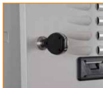
Serratura con apertura chiave elettronica Transponder key Serrure électronique Schloss mit Öffnung durch elektronischen Schlüssel