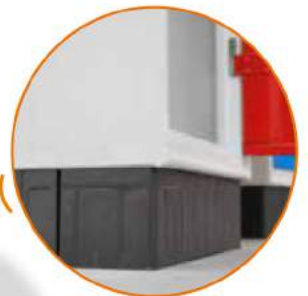
Zoccolo in polipropilene Plastic plinth Socle en polypropylène Sockel aus Polypropylen