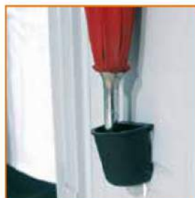
Porta ombrello con vaschetta raccogli gocce Umbrella holder with drip-tray Porte-parapluie avec petit égouttoir Regenschirmhalter mit Tropfschale