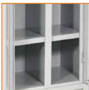
Piano porta scarpe S/P Shelf for shoes Tablette pour chaussures Schuhfach mit innerer Trennwand