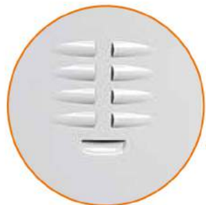
Feritoie d'aerazione Aeration slits Fentes d'aération Lüftungsschlitzen