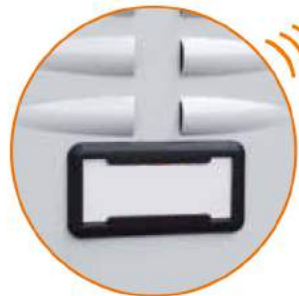
Porta cartellino in plastica Plastic card holder Porte-étiquette en plastique Namensschildhalter aus Kunststoff