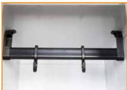
Tubo ovale porta grucce in PVC completo di ganci scorrevoli Plastic coat hanger rod and sliding hooks Tringle porte-cintres en PVC avec crochets coulissants Oval Rohr aus PVC mit beweglichen Kleiderhaken