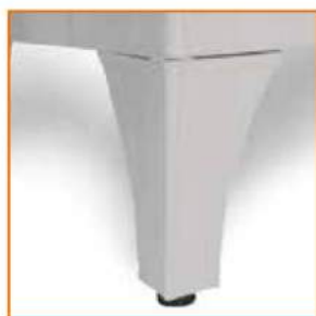
Piedi regolabili con puntali in plastica Adjustable feet Pieds réglables avec coquille en plastique Hohenverstellbare Füße mit Gummienden