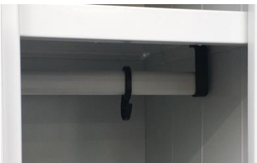
Appenderia interna in PVC