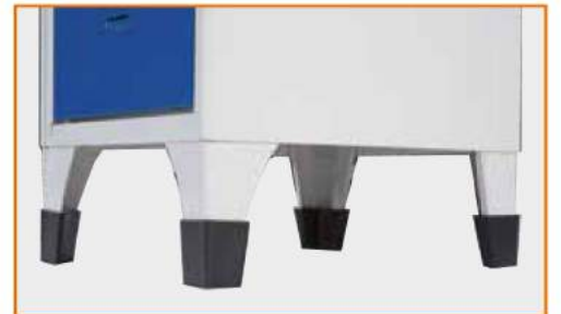
Copripiedi in plastica anti corrosione Plastic shells for feet Coquille en plastique pour pieds Kunststoffhalter für Füße als Korrosionsschutz