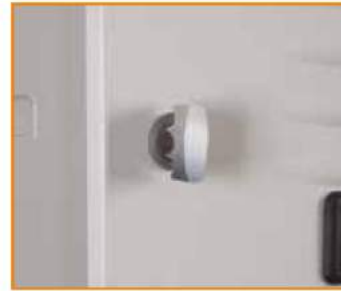
Maniglia in metallo lucchettabile a frizione con sistema anti effrazione Freewheeling padlock handle Fermeture à cadenas Sicherheitsdrehriegel für Vorhängeschloss