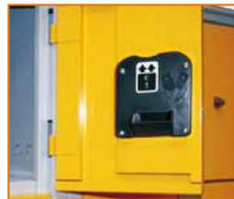
Serratura a moneta (con funzionamento a cauzione) Coin lock (public use) Serrure à monnayeur (à caution) Münzpfandschloss (Kautions Arbeitssystem)