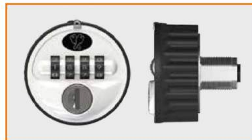
Serratura a combinazione meccanica (passepartout disponibile) Combination lock (master key available) Serrure à combinaison mécanique (passepartout disponible) Mechanisches Zahlenschloss (Passepartout verfügbar)