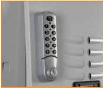
Serratura con apertura a codice elettronico Electronic lock (master key available) Serrure à code électronique Elektronisches Zahlenschloss