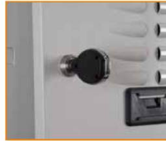
Serratura con apertura chiave elettronica Transponder key Serrure électronique Schloss mit Öffnung durch elektronischen Schlüssel